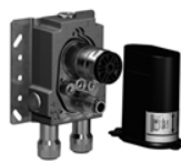
35 021 970 90 UP-Einhandbatterie mit Sicherungseinrichtung -